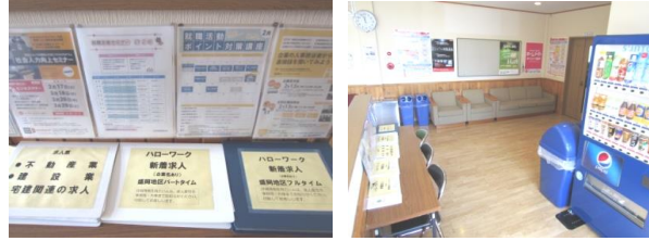
休憩ロビーに毎日更新の求人票を設置