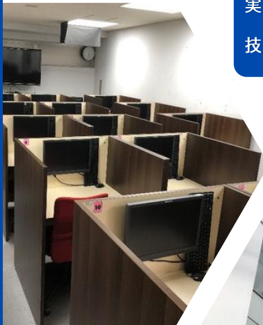
▲ 訓練で使用する教室