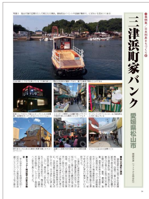
「日本列島まちづくり」より