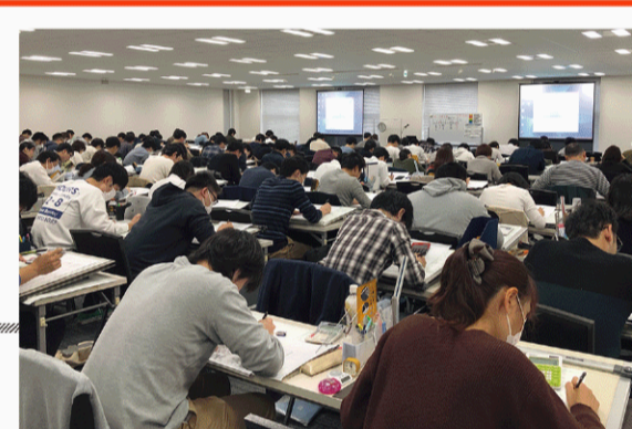
受験資格緩和により受験の関口も広がった「日建学院上野会場」

間で約14%減少するなど、対応する要員が少なくなっている。東京一極集中や人口減少、少子高齢化により、今後さらに職員数が減少する傾向にあるため、人員確保対策も急を要している。