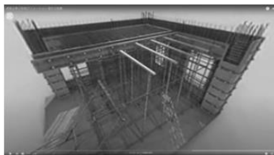
部分工程編 (RC躯体) 360°動画

今回、株式会社建築資料研究社／日建学院は、DX（デジタルトランスフォーメーション）の推進のデジタル教材の映像制作に協力いたしました。ぜひ、各職種の熟練技能者がどのように作業しているか、建設技能学習にデジタル教材をご活用ください。