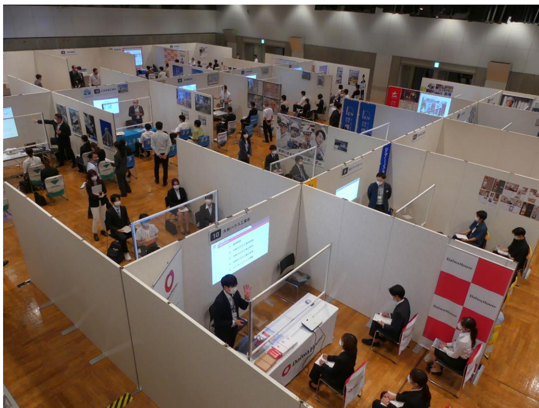
2021年9月25日(土) アクロス福岡にて①

https://peraichi.com/landing_pages/view/architect-seminar2311