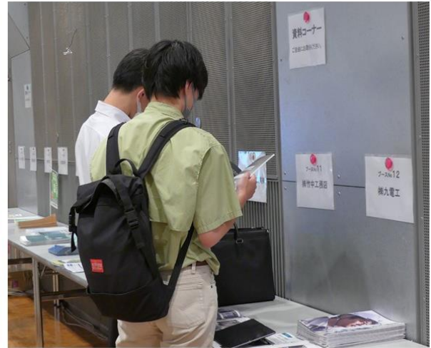
2021年9月25日(土) アクロス福岡にて②