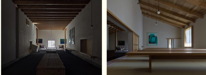
後藤昭夫美術館